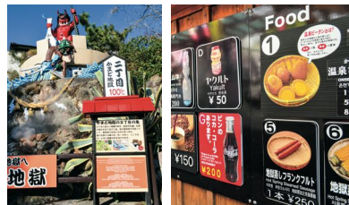
かまど地獄 看板・レストランメニュー