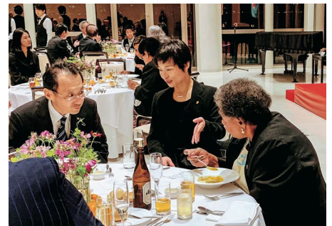
ラグビーワールドカップ フィジーレセプション 司会・来賓通訳