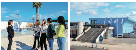
大分マリンパレス水族館「うみたまご」館内表示 3言語年間契約(英・中・韓)