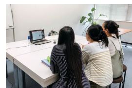
企業語学研修 TRY株式会社 外国人技能実習生のオンライン日本語研修