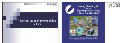
大分県外国人防災モニター 研修会資料・アプリ