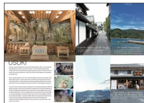
くらたび白杵 白杵市ガイドブック(仏)